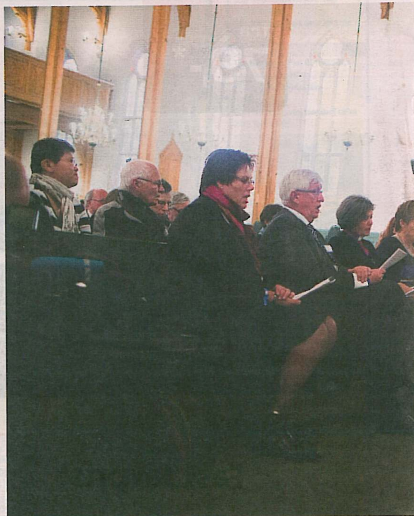
Kyrkjemøtet i 2013 kom med sterke utfordringar om ein ny klimapolitikk. Biletet er frå opningsgudstenesta i Kristiansand domkyrkje.

Vekst og forbruk. Kyrkjemøtet er ikkje den einaste autoriteten innanfor Den norske Kyrkja